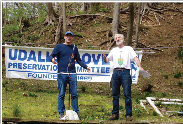
브라운스틴 주 하원의원이 49주년 유달 만 보존 위원회 연례회의 및 습지 정화 사업에 참석.