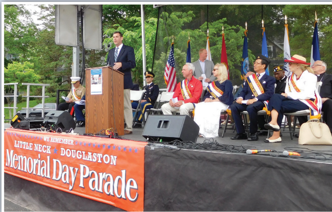
91주년 리틀 넥 - 더글라스턴 현충일 기념 행진에 참석한 브라운스틴 주 하원의원.

브라운스틴 주하원의의 지역구 사무실 전화번호는 718-357-3588 입니다. 사회복지사와의 상담을 원하시면 전화 주시기 바랍니다.