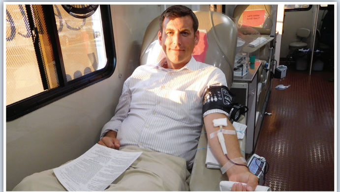
베이 테라스 쇼핑 센터에서 열린 본인의 의원 사무실 6주년 여름 헌혈 드라이브에서 헌혈하는 브라운스틴 주 하원의원. 이 행사는 뉴욕 주 혈액원과 합동으로 진행하여, 100명 이상이 동참.