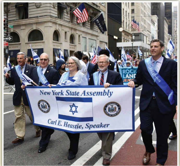
브라운스틴 주 하원의원은 맨하탄에서 열린 이스라엘 건국 70 주년을 기념하는 세계 최대 규모의 행진에 참여하였습니다.