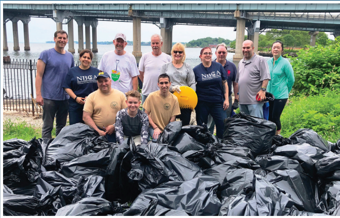
브라운스틴 주 하원의원은 보이스카웃 268 부대, 그레이터 화이트스톤 납세자 시민 단체, 노스웨스트 베이사이드 시민 단체와 함께 리틀 베이 파크 환경미화 행사를 개최하였습니다. 이 날 약 쓰레기 봉투 100개 이상 분량의 폐기물이 수거되었습니다.