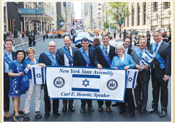
州眾議員布朗斯丹參加了在曼哈頓舉行的“慶祝以色列的遊行”，這是世界上慶祝以色列成立71週年的最大公共活動。