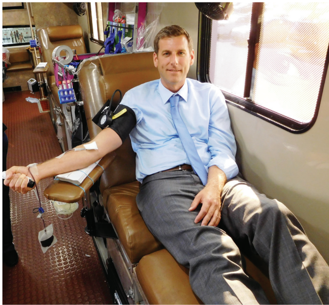
在州眾議員布朗斯丹和紐約血液中心聯合在海灣露台購物中心舉辦的第七屆年度夏季獻血活動中有 138 位捐獻者前來獻血，打破了以往的記錄。