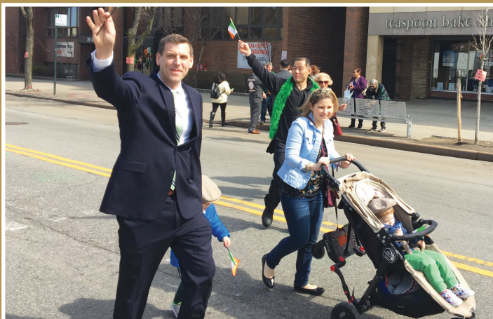
州眾議員布朗斯丹參加貝賽第二屆年度聖帕特里克節遊行。