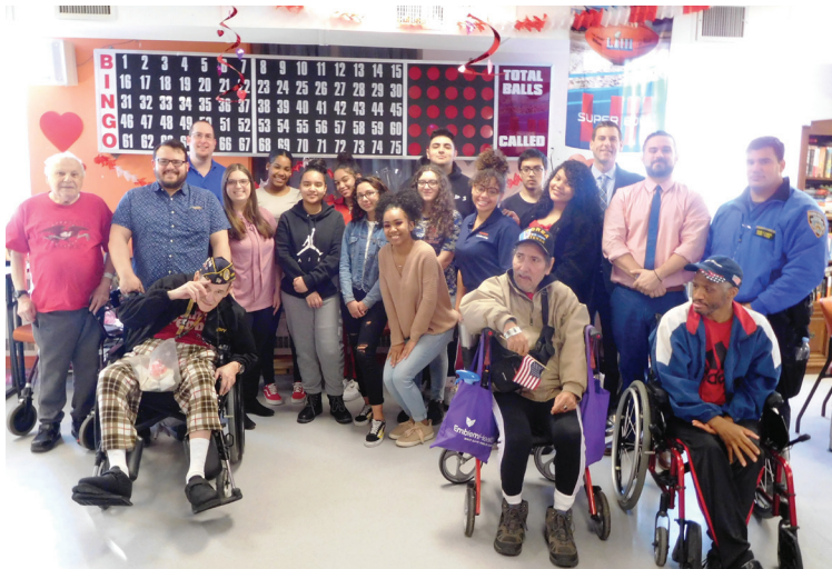
州眾議員布朗斯丹和來自 Benjamin N. Cardozo 高中的學生把在我們社區第23屆年度情人節為退伍軍人捐贈禮物的活動中收到的禮物送到聖奧本斯退伍軍人療養中心。

房主免稅計劃和老年公民免加租計劃。您若想與案例工作人員約時間，請致電州眾議員布朗斯丹辦公室，電話號碼：718-357-3588 。