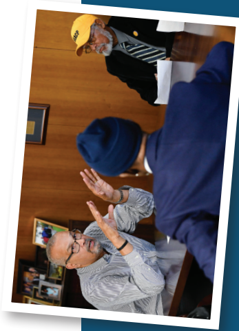
Speaker Pro Tempore Portavoz Pro Tempore / 代理議長 Jeffrion Aubry / 傑佛里昂·奧布裡

PRSRT STD. U.S. Postage PAID Albany, NY Permit No. 75