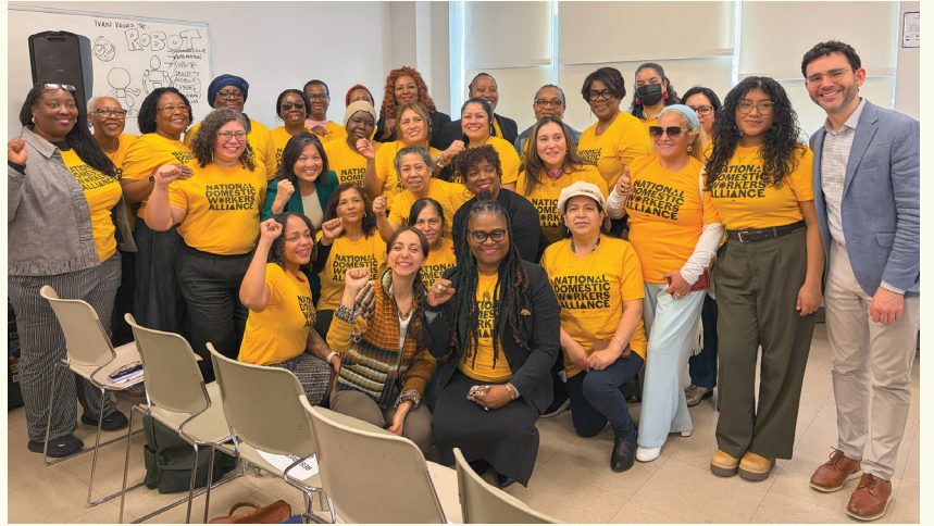
4 أبريل 2026: عضوة الجمعية مورينو مع التحالف الوطني للعمال المنزليين (NDWA)، ونائبة العمدة جولي سو، والمفوض صامويل ليفين، بعد إلقاء كلمة في فعالية نظمتها إدارة حماية المستهلك والعمال في مدينة نيويورك (DCWP) في لونغ آيلاند سيتي.

ساعد فريق خدمات الناخبين لدينا مئات الناخبين خلال الأشهر الأولى من تولينا المنصب. وفيما يلي بعض الأمثلة: