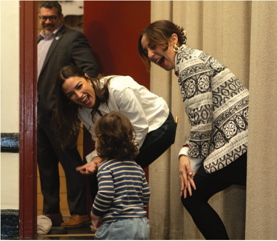
5 فبراير 2026: عضوة الجمعية مورينو وأسرتها يحضرون لقاء عامًا في أستوريا استضافته عضوة الكونغرس ألكسندريا أوكاسيو-كورتيز. (بعدها: سيلاس إيمرسون هاريس)