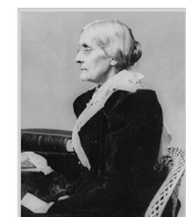
Susan B. Anthony (1820-1906)

Sotomayor出生並成長于布朗士郡，她在10歲的時候就知道自己要去讀法學院。她是她高中畢業典禮上代表班級的演講者。她畢業于普林斯頓大學和耶魯大學，隨後在紐約市當律師和法官。2009年5月，她由歐巴馬總統任命為美國最高法院法官。她是最高法院的第111名法官、第1名拉丁美洲裔法官、以及第3名女法官。