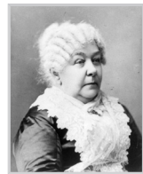
Elizabeth Cady Stanton (1815-1902)

她來自紐約州的Johnstown，在紐約中部發起並領導了婦女權利運動，她積極地協助組織了在Seneca Falls召開的第一屆婦女權利大會，並花費了她一生的大部分時間奔走在全國各地和全世界，為婦女的權利抗爭。