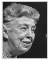
Eleanor Roosevelt (1884-1962)

她來自紐約州的Johnstown，在紐約中部發起並領導了婦女權利運動，她積極地協助組織了在Seneca Falls召開的第一屆婦女權利大會，並花費了她一生的大部分時間奔走在全國各地和全世界，為婦女的權利抗爭。