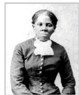
Harriet Tubman (c.1820-1913)

Anthony在六歲的時候從麻州遷移到紐約州，是美國歷史上最著名的女權活躍分子之一。她在Seneca Falls的婦女大會上跟Elizabeth Cady Stanton一起合作過，並在50年當中，每年都要做50至70次有關婦女權利的演講。