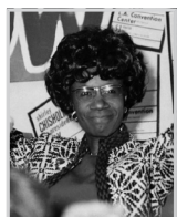
Shirley Chisholm (1924-2005)

這是一位終身的紐約人，並且是1933-1945年間的美國總統第一夫人，還是一位著名的作家、演說家、政治家、活動家以及人權創始人。她不知疲倦地為改善弱勢美國人的條件而抗爭，並起草了聯合國全世界人權宣言。