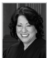
Sonia Sotomayor (1954- )

2008年克林頓被歐巴馬總統任命為美國第67屆國務卿。她是第一位代表紐約州的女國會參議員(2001-2009)，並且是1992年至2000年的總統第一夫人。克林頓當選國會參議員是首次美國總統第一夫人當選國家公職。