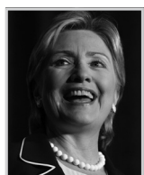
Hillary Rodham Clinton (1947- )

Chisholm出生于布碌侖一個移民的家庭，曾經是紐約州眾議院的議員，並且是第一位當選為美國國會的黑人女議員，從1968年上任後一直連續當選直至1982年退休。在她的整個政治生涯中，她一直致力于改善老城區居民的機會，並把工作中心放在教育和醫療的改革上。