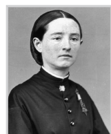
Dr. Mary Edwards Walker (1832-1919)

Tubman于1849年從馬里蘭州的奴役中逃出來，變成了“秘密通道”的生力軍。她冒著生命危險無數次地回到奴役領地，護送了七十多名奴隸走向自由。1859年她在紐約州Auburn買了一塊地，並在那里度過了她的余生，直至1913逝世。