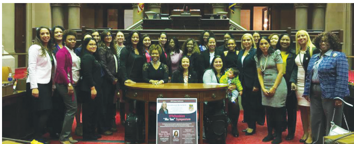
Assemblywoman Davila and Assemblywoman Williams Standing alongside Supreme Court Judge Laporte, Attorneys, and Constituents La asambleísta Dávila y la asambleísta Williams junto a la juez de la Corte Suprema Laporte, abogadas y constituyentes

El panel estuvo conformado por un grupo de poderosas y dinámicas mujeres latinas provenientes del sector legislativo, judicial y privado. El simposio sirvió como un mecanismo de enseñanza para informar al pueblo sobre cómo discernir y reconocer el acoso sexual. El acoso sexual se ha convertido en un asunto importante y continúa aumentando a través de los años con más de 33 millones de casos solamente en los Estados Unidos.