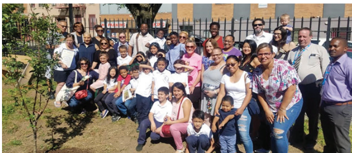
Members of the community gather around the garden Miembros de la comunidad se reúnen alrededor del jardín

P.S. 376 so that students, teachers and parents can use the space to harvest food and host a variety of classroom activities. This garden project has shed light on the importance of healthy living and community engagement.