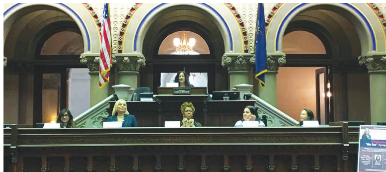
Panelist Addressing Sexual Harassment Concerns Una panelista aborda asuntos sobre el acoso sexual

If you believe you have been a victim of sexual harassment contact: Si usted considera que ha sido víctima de acoso sexual comuníquese con el: CIVIL RIGHTS BUREAU NYS ATTORNEY GENERAL’S OFFICE DEPARTAMENTO DE DERECHOS CIVILES-OFCINA DEL FISCAL GENERAL DEL ESTADO DE NUEVA YORK 120 Broadway, New York, NY 10271 • (212) 416-8250 • (800) 771-775 • civil.rights@ag.ny.gov