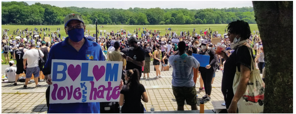
Demostración pacífica en el parque Van Cortlandt tras el asesinato de George Floyd en Minneapolis.

Esta legislación prohibiría el uso del historial crediticio del consumidor en las determinaciones de contratación, empleo y licencias. Se ha demostrado que los historiales de crédito frecuentemente tienen errores materiales que no se detectan o no se corrigen, y hay poca o ninguna evidencia de una correlación entre el historial de crédito y el desempeño laboral. El proyecto de ley fue aprobado en la Asamblea, pero está esperando acción en el Senado estatal. (A2611)