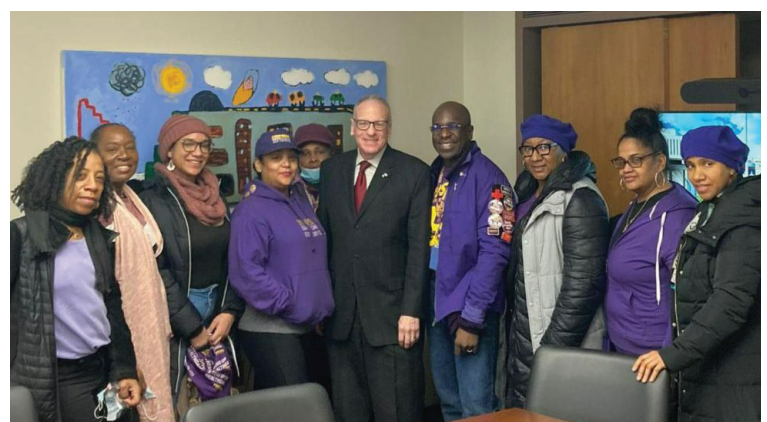
Assemblyman Jeffrey Dinowitz is with members of 1199SEIU in Albany after discussing their legislative priorities for the state budget.

El asambleísta Jeffrey Dinowitz, colegas y miembros del Sindicato 1199SEIU abogan por el cuidado a domicilio y salarios más altos.