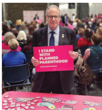
Assemblyman Jeffrey Dinowitz holds up a sign in support of Planned Parenthood.

I advocated for Planned Parenthood in support of reproductive rights. Planned Parenthood activists from across New York State came to Albany to meet with representatives and advocate for sexual and reproductive health, rights, and justice. Planned Parenthood's legislative priorities are the Reproductive Freedom and Equity Fund, Comprehensive Sexual Education, and funding for sexual and reproductive health services.