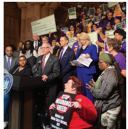
Assemblyman Jeffrey Dinowitz, colleagues, and members of 1199SEIU advocate for homecare and higher wages.

Participé en conversaciones con representantes del Sindicato 1199SEIU sobre nuestras prioridades en común. Estas incluyen asegurar el financiamiento total de las tarifas de Medicaid para el 2028, salvaguardar el dinero de las primas del estado de Nueva York para que permanezca dentro del estado, y hacer la transición del Cuidado a Largo Plazo de Medicaid a un modelo de servicios con tarifas.