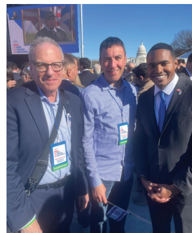
Assemblyman Jeffrey Dinowitz, Council Member Eric Dinowitz, and Congressman Ritchie Torres, and 300,000 supporters of Israel. Behind them is the United States Capitol.

Presenciar tanto apoyo por Israel, incluyendo de parte de nuestros funcionarios electos del Bronx que me acompañaron en la manifestación, fue conmovedor.