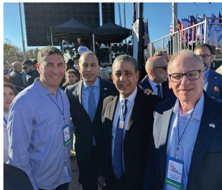
Council Member Eric Dinowitz, House Minority Leader Hakeem Jeffries, Congressman Adriano Espaillat, and Assemblyman Jeffrey Dinowitz rallied from DC.

A colossal assembly of hundreds of thousands of Jews and allies of the Jewish community convened in Washington, DC, for the "March for Israel" rally. With an estimated attendance of up to 300,000 individuals, it was perhaps the largest pro-Israel gathering ever. The rally served as a resounding display of solidarity with Israel, a call for the release of hostages, and a vehement condemnation of antisemitism.